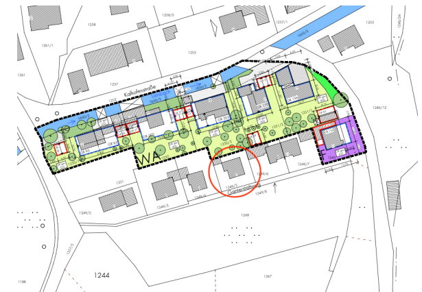
Screenshot at May 06 10-34-45